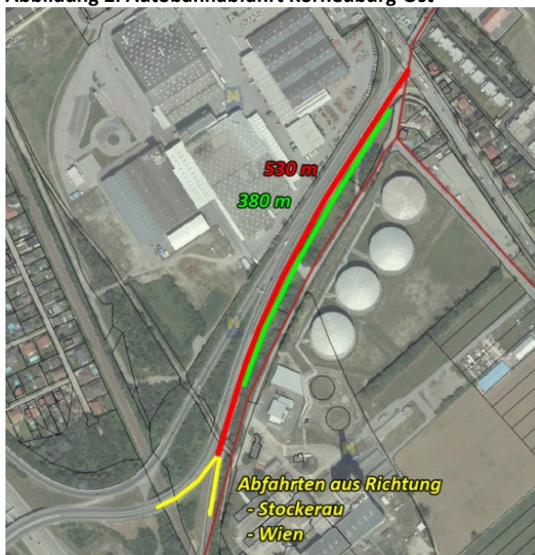
Abbildung 2: Autobahnabfahrt Korneuburg-Ost